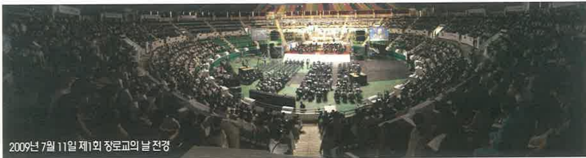
2009년 7월 11일 제1회 장로교의 날 전경

몇주전 근목수련회에 이종운은 강사로 초청되어 특강을 한 후 head table에서 환경직목사와 국방부장관등과 식사를 하게 된다. 한목사께서 “이종운목사님, 우리 장로교회는 본래 하나였는데 지금은 많이 갈라져 있어 좀 부끄럽습니다. 어차피 다시 하나가 될 터이니 지금이 기회인 것 같습니다. 이 목사께서 우리 통합교단에 들어오시면 좋겠다”고 하자 옆에 앉아 있던 관석회목사가 “제가 책임지겠습니다.” 했다. 그 후 새문안교회 김동익목사가 “선배님 우리 교단 오시도록 길을 잘 마련해 놓을 터이니 고개만 끄덕이시면서 초청에 응하시면 됩니다.”라는 전화통화를 준다. 그리고 서울강남노회 증경노회장 7분이 이종운을 찾아왔다. 우리가 잘 모실테니 우리 노회로 들어오시라 한다. 공교롭게도 그 7분은 모두 이종운의 제자들이었다. 안팎으로 사안이 무르익게 되자 이종운은 방향을 정하고 대한예수교 장로회(통합측) 서울강남노회에 가입을 한다. 강남노회는 생긴 지 얼마 안되는 신생노회지만 한국을 대표할만한 긍지와 자질을 갖춘 노회였다. 이종운은 노회장이 되어 월간회보 발간, 부활절 연합예배, 회의비 지출을 막아 전도비로 1억원의 저금통장과 5,000만원 이월금까지 남겨 주면서 노회 분위기를 쇄신시켰다.