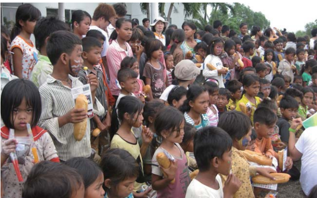
2009년 캄보디아 단기선교 - 어린이 성경 공부 사역에 모인 어린 영혼들

그래서 이번 단기선교를 통해 크메르민족이 그리스도 앞으로 돌아오는 구원의 새 역사가 캄보디아 땅에 일어나기를 소원하며 또한 기도하고 있습니다. 여러분의 많은 참여와 기도를 부탁드립니다.