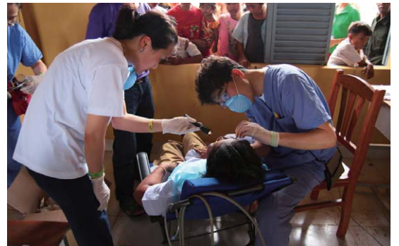
2009년 캄보디아 단기선교 - 의료선교팀의 의료현장